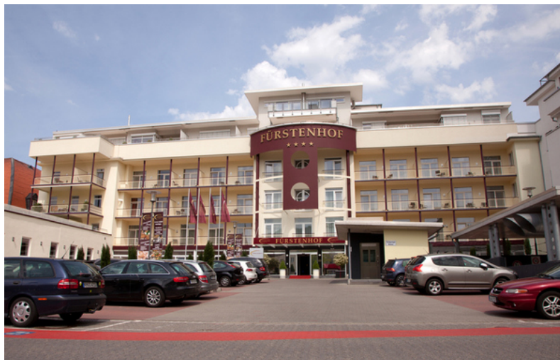
Sympathie Hotel Fürstenhof